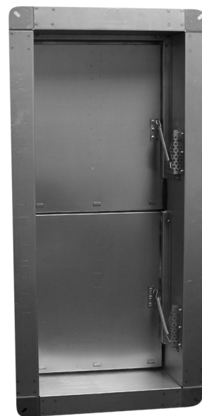
Клапан КИД (90)

Размер проема в ограждающей конструкции тамбур-шлюза определяется проектировщиком в зависимости от производительности и давления вентиляторов дымоудаления и подпора противодымной системы.